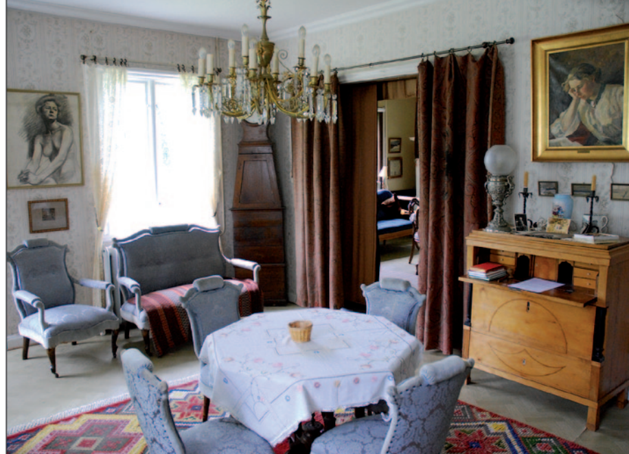
En del av salongen i Villa Solfrid.