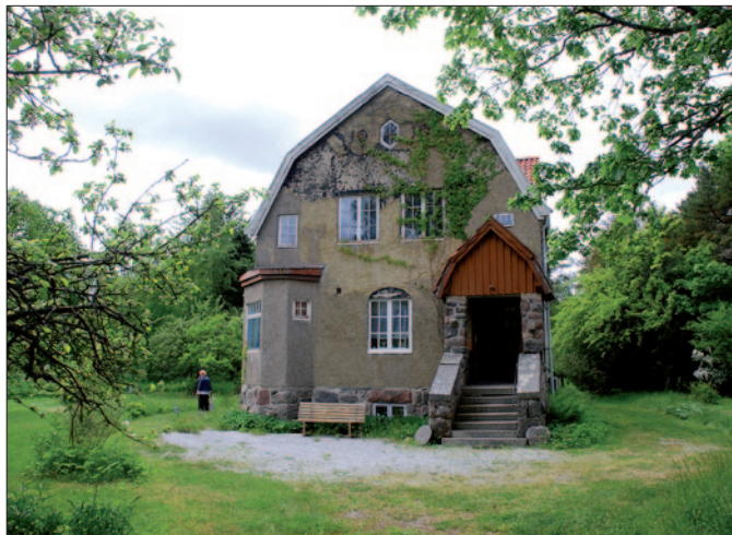
Villa Solfrid omges idag av en rik och varierad växtlighet.